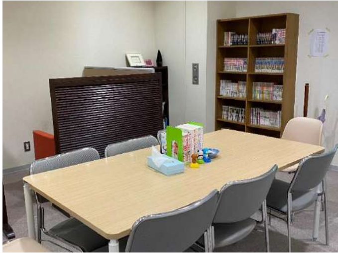
こころの休憩室の室内