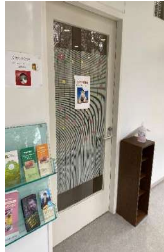
こころの休憩室出入口