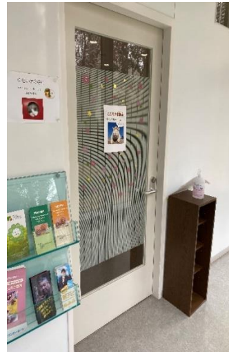
こころの休憩室出入口