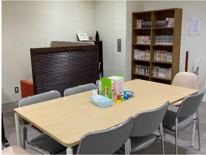
こころの休憩室の室内