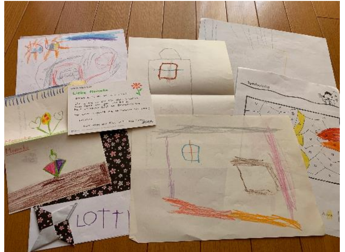
この写真は幼稚園最終日に子供たちがくれたものです