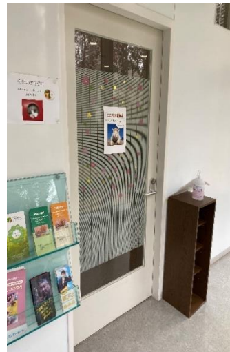
こころの休憩室出入口