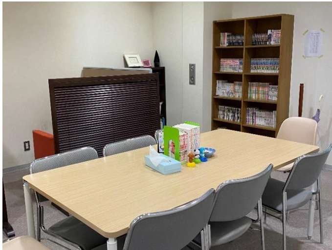
こころの休憩室の室内