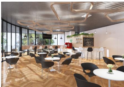
▲Comorebi Café イメージ

麗澤大学(千葉県柏市/学長：徳永澄憲)は校舎「あすなろ」2階の iFloor (アイフロア：International Floor) を全面的にリニューアルしました。2011年のオープン当初から iFloor には iLounge (アイラウンジ：International Lounge) が設置され、語学サロンとしてネイティブ教員が常駐するなど語学能力向上のための施設として留学生や日本人学生が集まり様々な活動を活発に行って来ました。2017年にはネイティブ教員11名からなる CEC (the Reitaku Center for English Communication) が開設され、本学における英語教育を最先端の技術・知見を取り入れました。今回 iFloor は英語学修を中心とする多機能セルフアクセス・ラーニングの場として全面リニューアルされ、7つのエリアを活動内容ごとに区切ることで、学生の多様な学びをサポートします。7つのエリアの詳細は別紙をご確認ください。